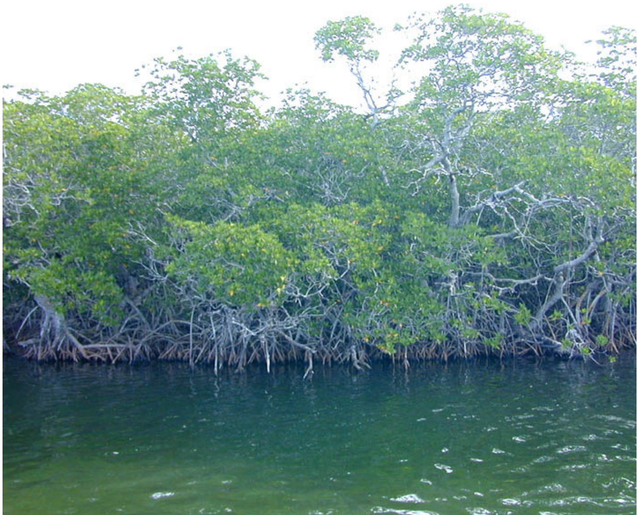
Mangrove begroeiing in Suriname, Commewijne

Update 2: Er zijn twee projecten voorbereid door SCPAM (LBB) en Dr Naipal in de mangrovezone die aan duurzaam toerisme verbonden zijn. Deze zijn: a) de bouw van een observatietoren van 15m hoogte, die boven het mangrovebos uitsteekt zodat men de modderbank en kustvogels kan observeren en b) de reconditionering en uitbreiding van de bestaande pier te Bellevue, nabij het onderzoeksstation van ADEK.